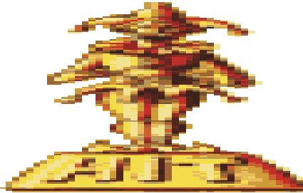
Ufen, Diese Schwämme soll nach Professor Chaykin vor, als er sich an seinen Antikwariat-Versuch sagte. Poch gab ihm irgendwas wie eine Schraube locker, weshalb sich unser Held nun unversehens in einer neuen Dimension wiederfindet! Hier herrscht glücklicher Golem von Urwesen, und die Erben der Erde sind auch noch lebendig!